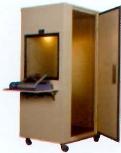
MODELO AB-4230 MODELO AB-4240 MODELO AB-4250

Las cabinas audiométricas Eckel son las unidades más prácticas y económicas disponibles - cabinas audiométricas de alta calidad especialmente diseñadas para proporcionar un rendimiento acústico sobresaliente. Su avanzado diseño incluye una construcción con levas de bloqueo que permite una mayor flexibilidad de movimiento, almacenamiento y transporte. El diseño con levas de bloqueo garantiza la integridad acústica, durabilidad y utilidad de la unidad. Ninguna otra cabina audiométrica en el mercado ofrece la superioridad y calidad de construcción que esta. La cabina viene ensamblada, lista para ser usada. Se ofrece la opción de un empaque desarmable para el transporte de exportación al por mayor. La puerta de acceso montada al ras con sello magnético continuo permite que la persona a examinar entre y salga de la cabina con facilidad. Iluminación, alfombrado, aisladores de vibración (ruedas de alta resistencia opcionales), panel de seis tomas telefónicas universales de 6,3 mm (1/4 pulg.) y ventilación por ductos de aire son todas características estándar.